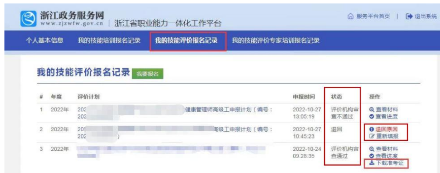
图 16（注：实际操作请根据健康照护师四级/中级工申报计划查看。）